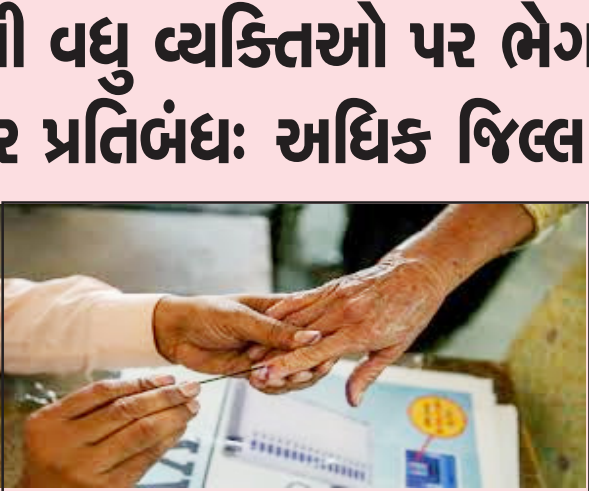
લગ્નના વરઘોડા, સિનેમા, ટાઉનહોલમાં, સ્મશાન યાત્રા, એસટી બસ, રેલ્વેમાં મુસાફરી કરતા, મંદિર મસ્જિદમાં પ્રાર્થના માટેના જતી વ્યક્તિઓ કે કામકાજના સ્થળે કામ કરતી વ્યક્તિઓને લાગુ પડશે નહીં.