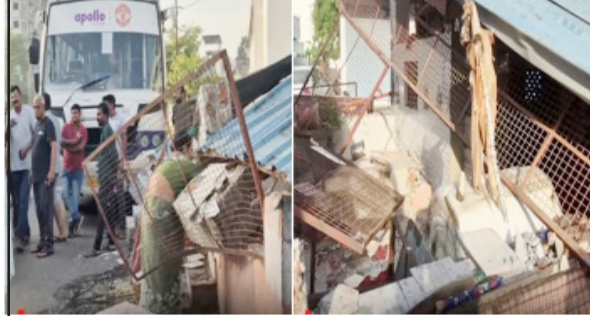
બસના ડ્રાઇવરને ઝોંકું આવી જતા બસ રોડ પરના એક મંદિર નાખશે શેડ સાથે ભટકાઈ હતી.

વડોદરાના સમા વિસ્તારમાં આજે સવારે અકસ્માતના એક બનેલા બનાવમાં મંદિરનો શેડ તૂટી પડ્યો હતો. જે દરમિયાન મંદિરમાં પૂજા કરતી એક મહિલાનો બચાવ થયો હતો. સમા પુનમનગર ચાર રસ્તા પાસે ગાયત્રી પાર્ક નજીક આજે સવારે એક ખાનગી કંપનીની બસ કર્મચારીઓને લઈને ઓફિસે જઈ રહી હતી ત્યારે બસના ડ્રાઇવરને ઝોંકું આવી