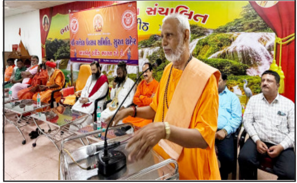
ભાઈચારાના સંદેશ સાથે સમગ્ર શહેરમાં ઉત્સવનું આયોજન કરવામાં આવશે.